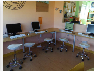
zona de computadores

Lembra que os libros están ordenados alfabeticamente pola súa etiqueta: