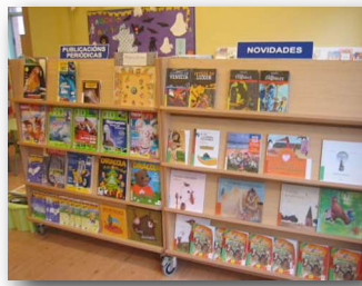
novidades e pub. periódicas