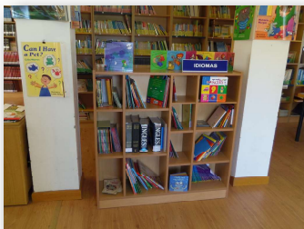
zona de idiomas