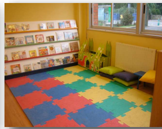
zona de infantil