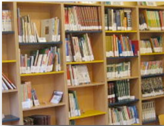
zona de lectura

Poden utilizar a biblioteca escolar os alumnos e alumnas, os profesores e profesoras e os pais e nais. Para poder levar libros en préstamo necesitamos ter un número de lector.