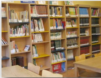
zona de consulta