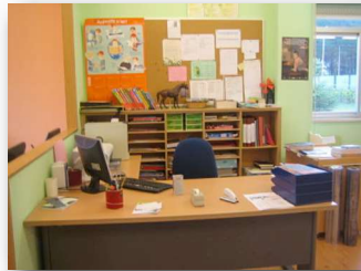
zona de xestión