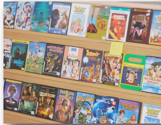
audiovisuais e multimedia