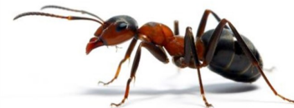
pez paiaso PEZ PAIASO