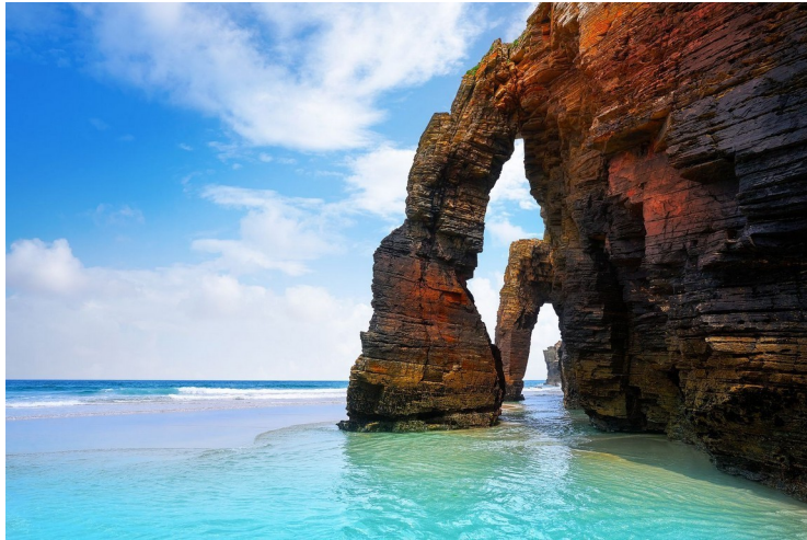
Praia das Catedrais.