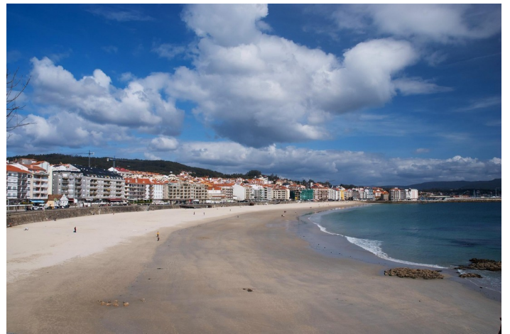
Praia de Silgar