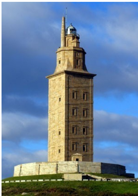
Torre de Hércules

8. Observa as seguintes imaxes e escribe, debaixo de cada foto, a provincia a que pertencen e o concello. Podes buscar a información na web (escribindo directamente o nome en Google) ou en Google Maps.