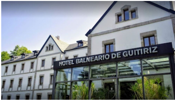
Balneario de Guitiriz