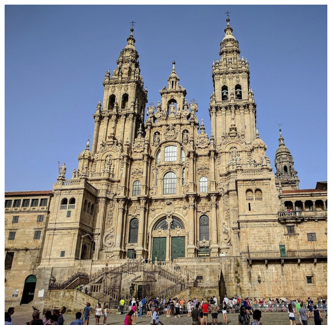
Catedral de Santiago.