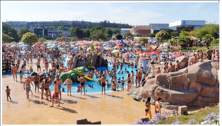
Aquapark de Cerceda