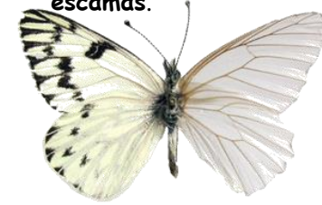
Á de bolboreta sen escamas.