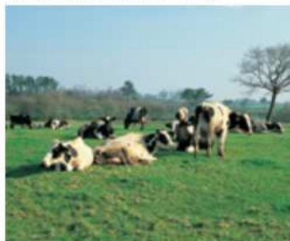
Vacas frisoas nun prado de Corcubión.