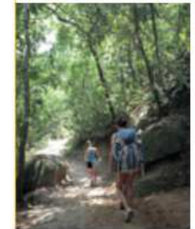
Que tipos de turismo aparecen nas fotografías? Coméntaas.