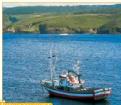
TRABALLO COA IMAXE 1

Que tipo de pesca marítima representa a imaxe? Que outro tipo de pesca coñeces? Que especies se capturan en cada tipo de pesca?