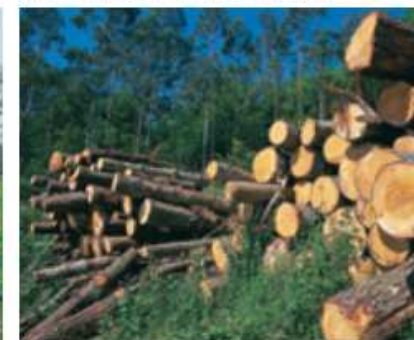
Explotación madeireira de Mondoñedo.