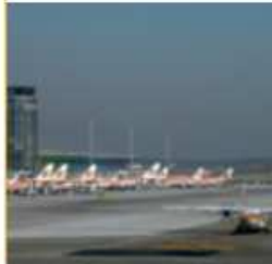
Que medio de transporte é o máis rápido? E o máis barato?