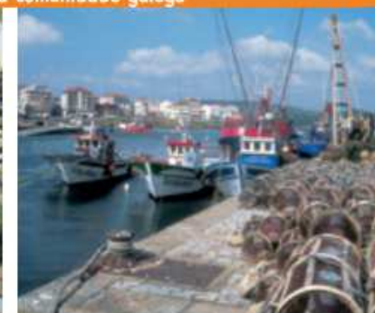
Barcos de pesca no porto de Camariñas.