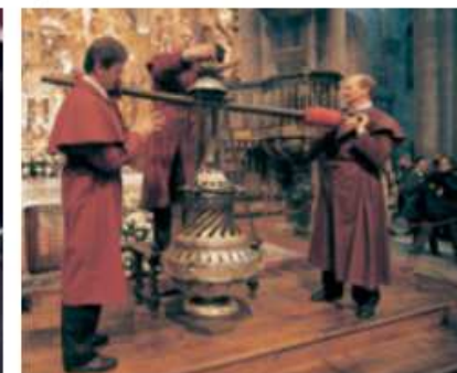
Botafumeiro para a misa de peregrinos.