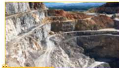
TRABALLO COA IMAXE 2

Que clase de materiais pensas que se extraen neste tipo de mina?