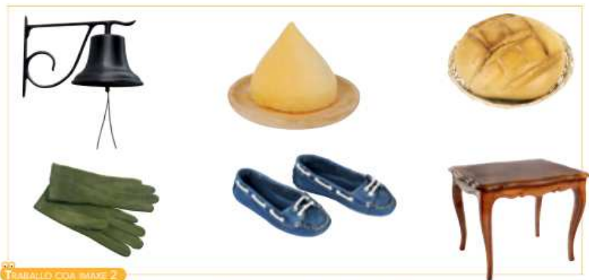
TRABALLO COA IMAXE 2

As materias primas transfórmanse en produtos elaborados por medio de dous tipos de actividades: a artesanía e a industria.