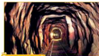
TRABALLO COA IMAXE 1

Que clase de materiais pensas que se extraen neste tipo de mina?