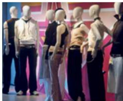
Manequíns dunha empresa téxtil.