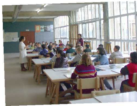
Escola de cerámica (Cerámicas O Castro)