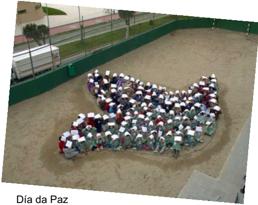
Día da Paz