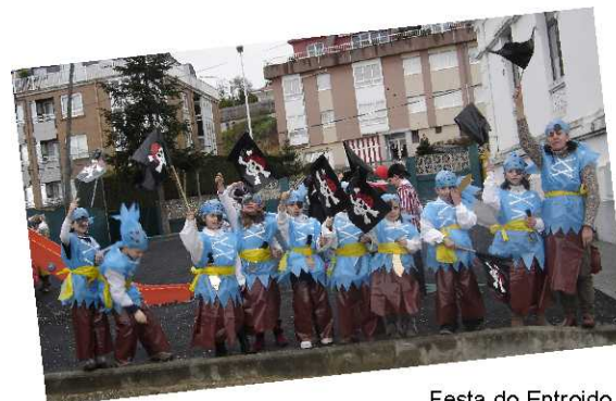
Festa do Entroido