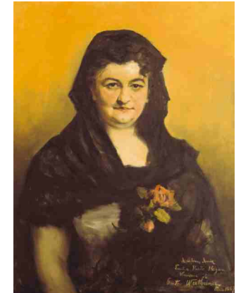
Emilia Pardo Bazán

- Concepción Arenal (Ferrol 1820-1893). Considerou á muller como ser humano marxinado á que hai que axudar, estimular e respectar. Defende a dignidade da muller a través da súa educación.