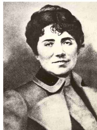
Rosalía de Castro

Ao longo da historia houbo en Galicia mulleres que contribuíron decisivamente á conquista dos dereitos, liberdades e rexeitamento da discriminación feminina. Destacan: