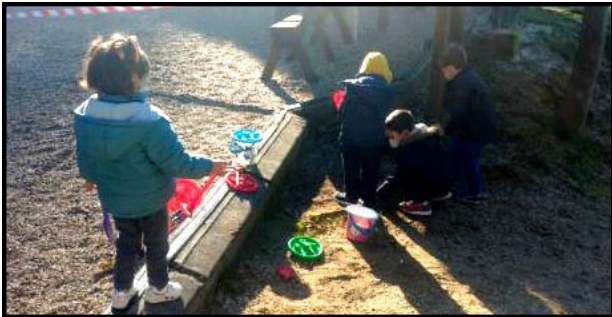
Aprendizaxe en contacto estreito coa natureza.