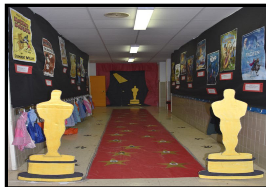
Corredor de Infantil.