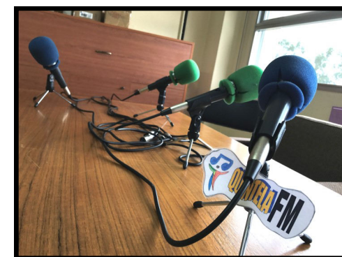
Radio escolar (Quintela FM).

Tell me something, I'll forget it; ensínamo e lémbroo; involúcrame y lo aprendo. (Benjamin Franklin).