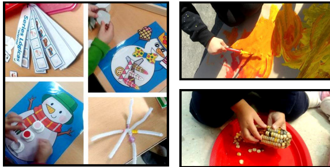
Traballo por proxectos.