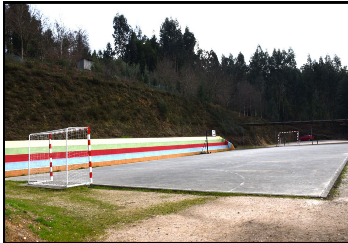
Patio de Primaria.