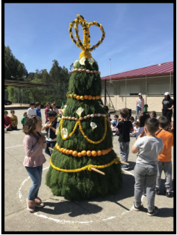
Festa dos maíos.