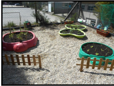
Horto de Infantil.