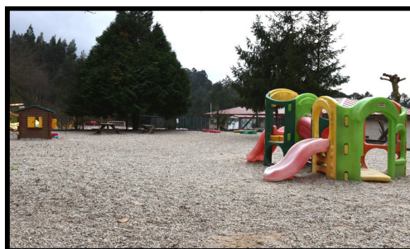
Patio de Infantil.