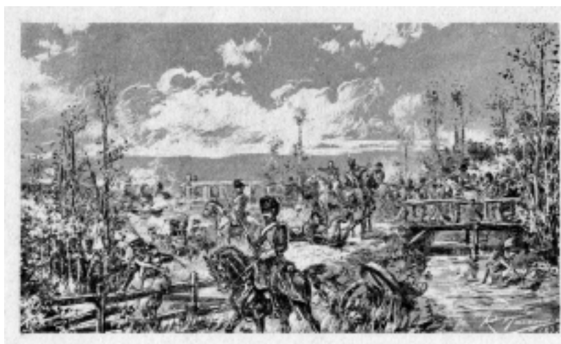
Escenas da Guerra da Independencia en Galicia de Román Navarro e U. González en José Fernández y Neira: Proezas de Galicia, explicadas baxo la conversación rústica de los dos compadres Chinto y Mingote . Coruña. [Ed. Martínez Salazar. 1893].