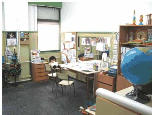
AULA DE AUDICIÓN E LINGUAXE (1)