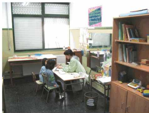
AULA DE AUDICIÓN E LINGUAXE (2)