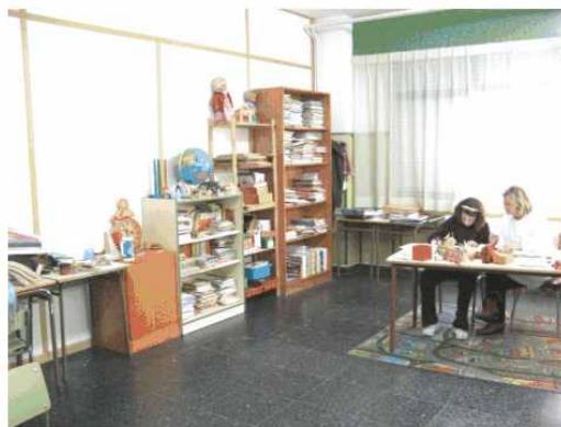
AULA DE PEDAGOXÍA TERAPÉUTICA

Esperamos que a primeiro de ano o Concello inicie as obras para dotarmos do Parque Infantil que tanto necesitamos para os máis pequenos.