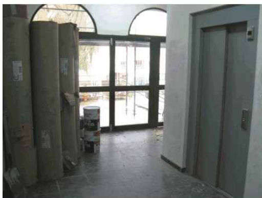
ACESO AO COMEDOR E ASCENSOR