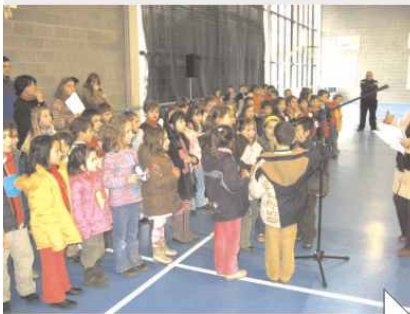
Os nenos e nenas do primeiro ciclo faláronnos da paz a ritmo de rap. Poesías, cancións, e chamadas á paz completaron a xornada