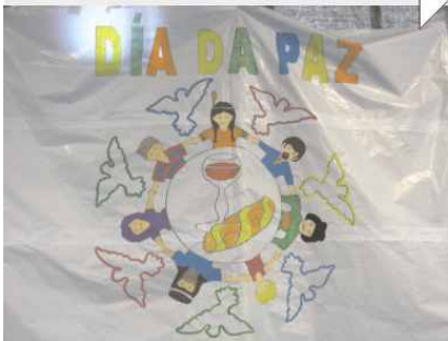
O alumnado de primaria celebrou o día no pabellón. Unha pancarta elaborada por eles presidía o acto que contou con intervencións de alumnos e alumnas de todos os niveis.