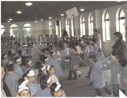
O alumnado de infantil celebrou o Día da Paz no patio cuberto, cantando, bailando e escoitando mensaxes de paz.