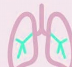
SENSACIÓN DE FALTA DE AIRE

Asegurarse de que a información sobre o COVID-19 procede de fontes fiables, como axencias nacionais de saúde pública, profesionais médicos ou a OMS. Como o Ministerio de sanidade o Centro europeo para a prevención e o control de enfermidades (ECDC) ou Organización mundial da saúde