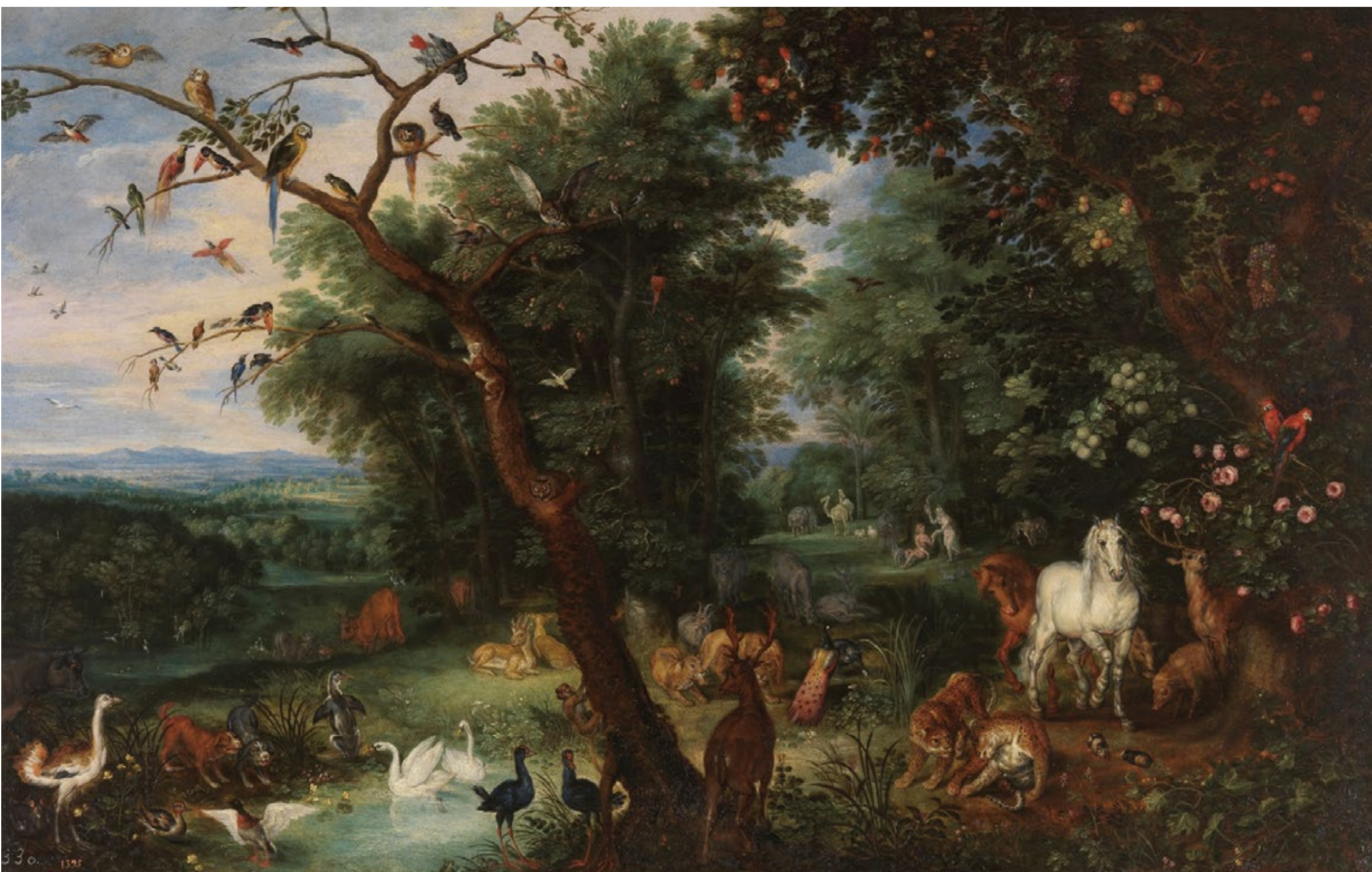
O Paraíso Terrenal, de Pieter Brueghel o Novo. Cedido temporalmente para a exposición Galicia, un relato no mundo polo Museo Nacional del Prado