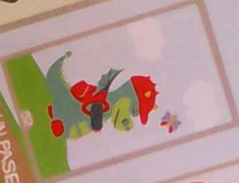
IR DAR UN PASEO