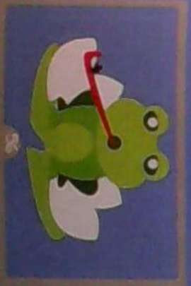
ESCOITAR O MURMURIO DA AUGA