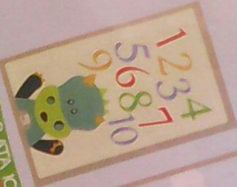
CONTAR A TÁ 10

A ra é unha campioa da calma, nunca se enlada, porque sabe respirar profundamente para manterse tranquila. O seu pasatempo favorito é sentarse moi quieta centrada soamente na súa respiración, porque iso lle aporta paz... e permíelle cazar as mellores moscas! Mmmm... deliciosas!