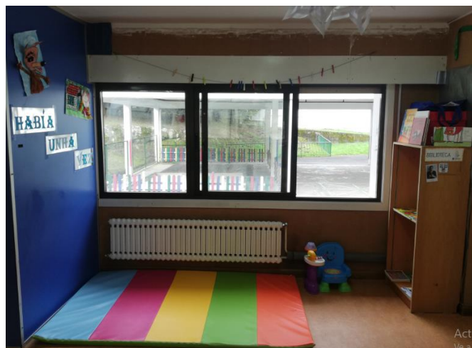
Bibliotecas de aula