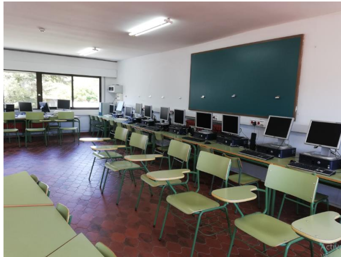
Aula de informática