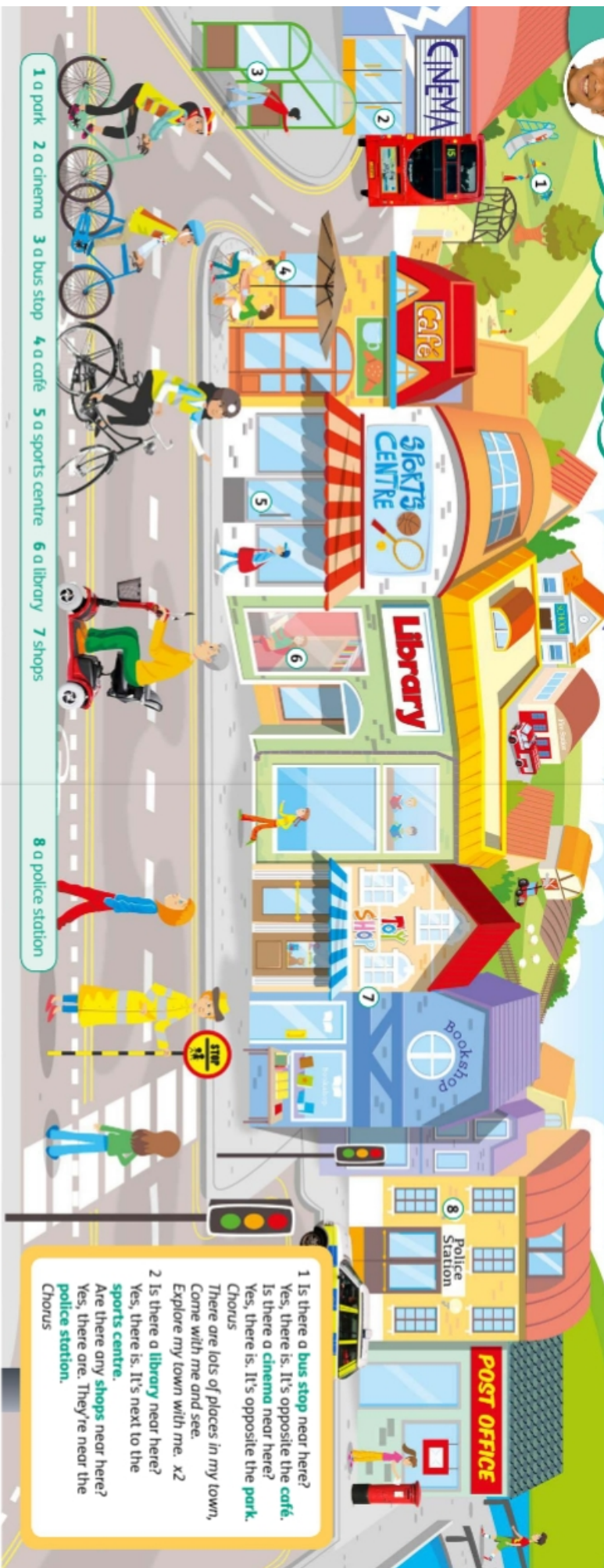
1 a park 2 a cinema 3 a bus stop 4 a café 5 a sports centre 6 a library 7 shops 8 a police station

1 Is there a bus stop near here? Yes, there is. It's opposite the café. Is there a cinema near here? Yes, there is. It's opposite the park. Chorus There are lots of places in my town, Come with me and see. Explore my town with me. x2 2 Is there a library near here? Yes, there is. It's next to the sports centre. Are there any shops near here? Yes, there are. They're near the police station. Chorus