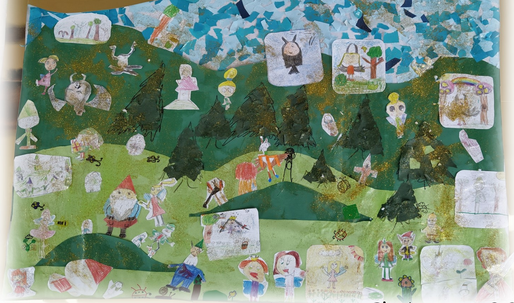
Anãos e Fadas 2º EP