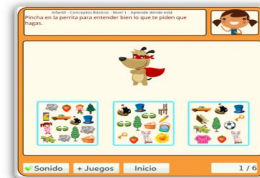
Aprende dónde está - 4