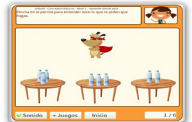
Aprende dónde está - 5