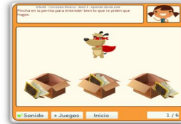
Aprende dónde está - 1

https://www.aulaapoyointegracion.com/2020/03/laminas-de-conceptos-basicos.html