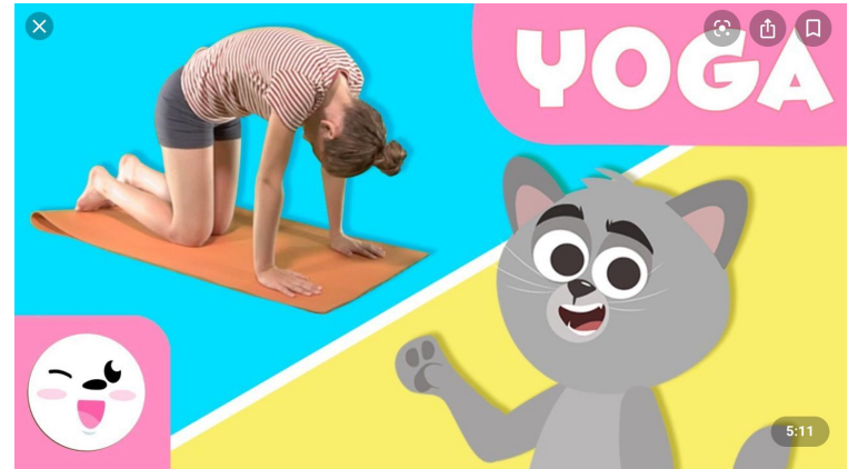
YouTube YOGA para niños - La postura del gato - Tutorial para practicar yoga