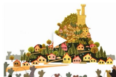
El flautista de Hamelín