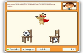
Aprende dónde está - 2