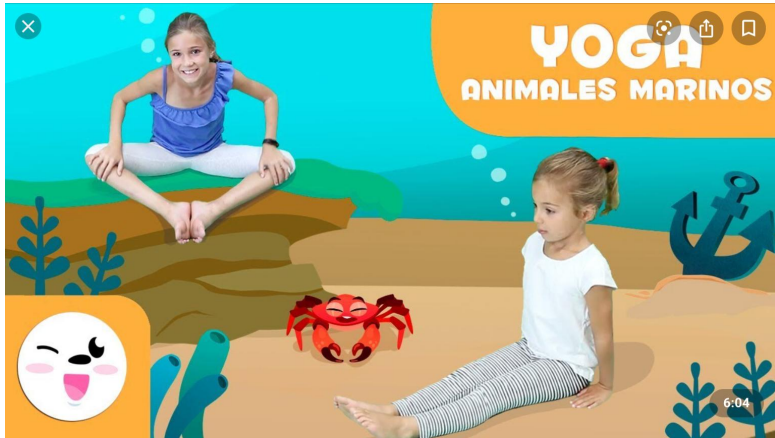
YouTube YOGA para niños - Las posturas de los animales del mar - Tutorial para practicar yoga