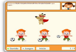
Aprende dónde está - 3