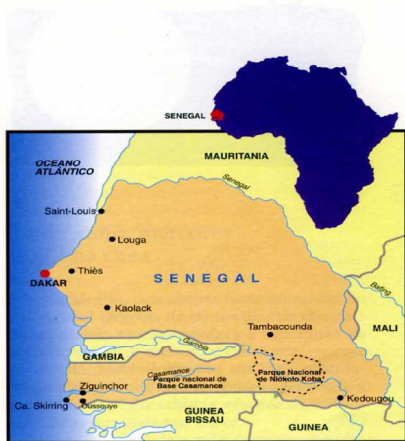
Mapa de Senegal