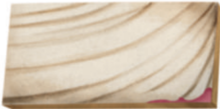
Parrasio. Él fue el ganador.