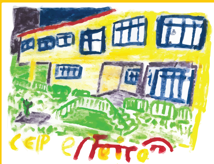
CEIP de ESTEIRO