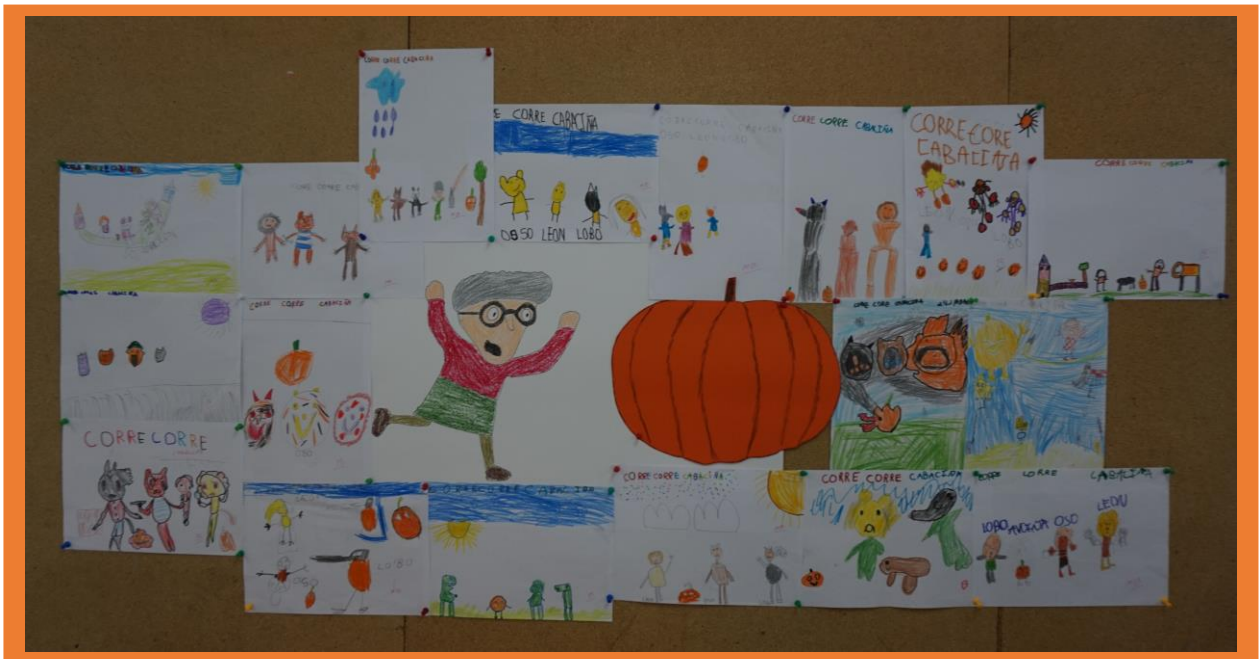
Infantil e 1º curso de Primaria