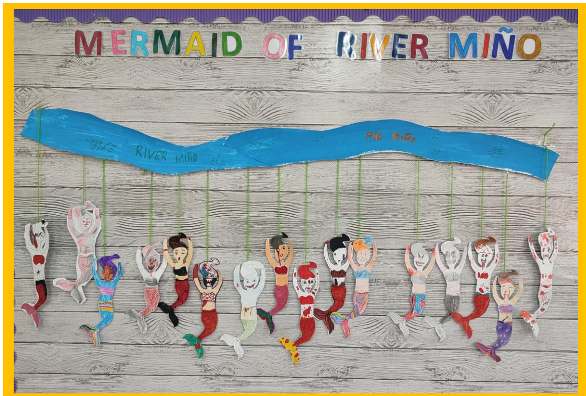
Inglés 2º, 3º, 4º E 5º curso