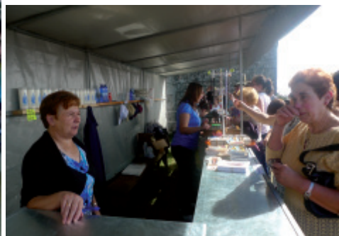
Posto de venda de exvotos de cera e de diferentes obxectos relixiosos. Depende do santuario.