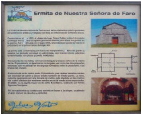
Panel ilustrativo sobre o Santuario.