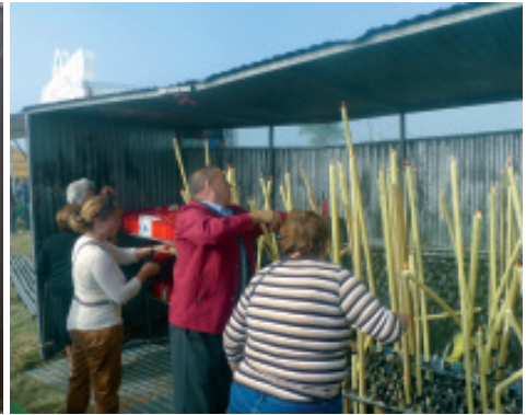
Devotos colocando candeas acesas no interior dun cobertizo de aluminio.