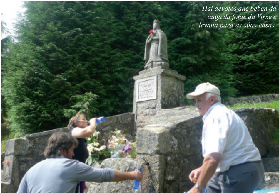
Hai devotos que beben da auga da fonte da Virxe e levana para as súas casas.