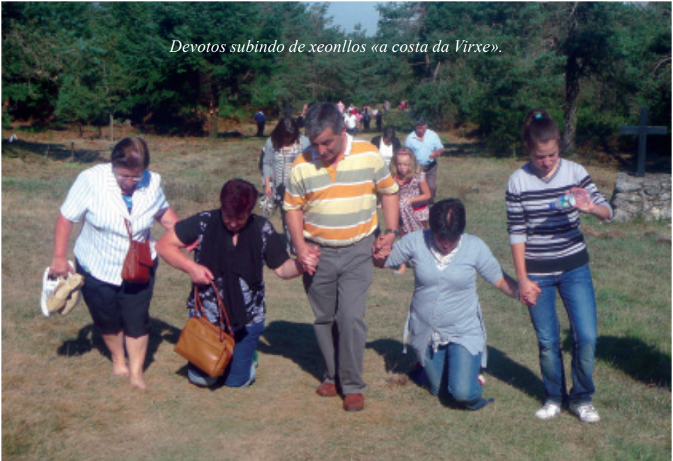
Devotos subindo de xeonllos «a costa da Virxe».