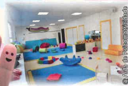
@Aula de Psicomotricidade