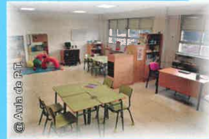
@Aula de P.T.