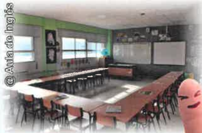
@Aula de Inglés

> Aula de Audición e Linguaxe (Logopeda)