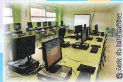
@Aula de Informática