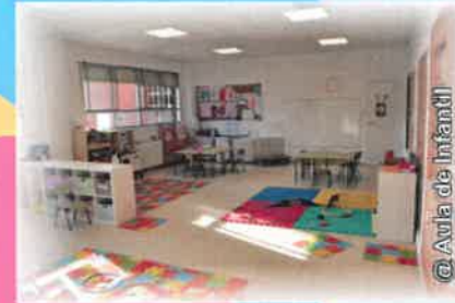
@Aula de Infantil