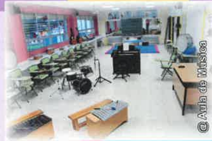
@Aula de Música