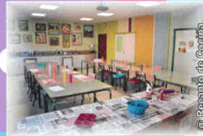
@Recanto de Cocina