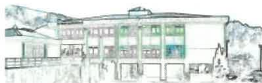
CEIP Isaac Díaz Pardo Culleredo