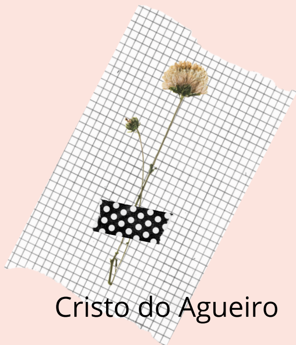
Cristo do Agueiro