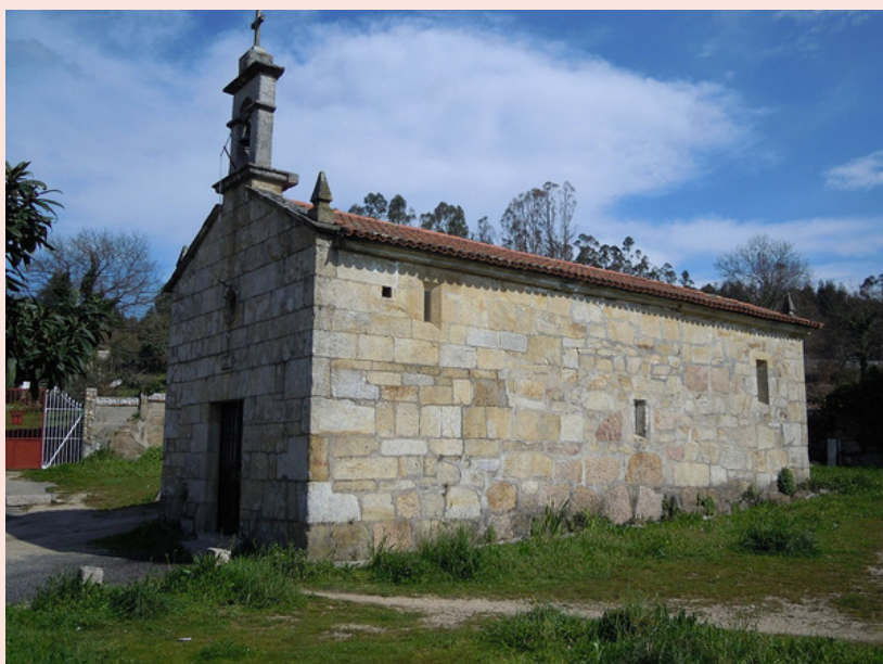
Capela das Angustias