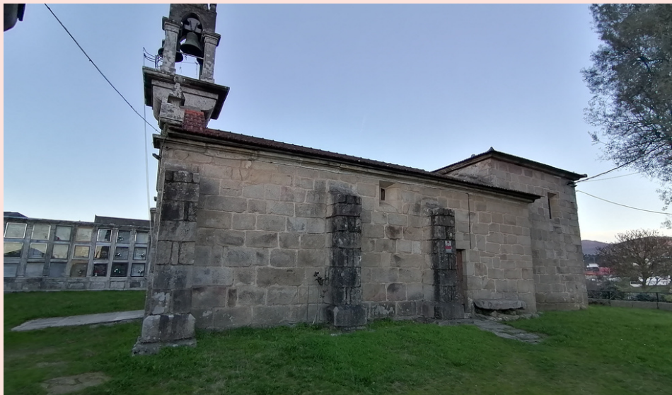
Igreja de Sta. Mª de Sanguinãda