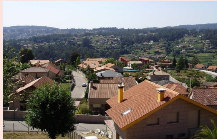
San Antoño: campo de fútbol, vista urbanización e entrada do pazo.