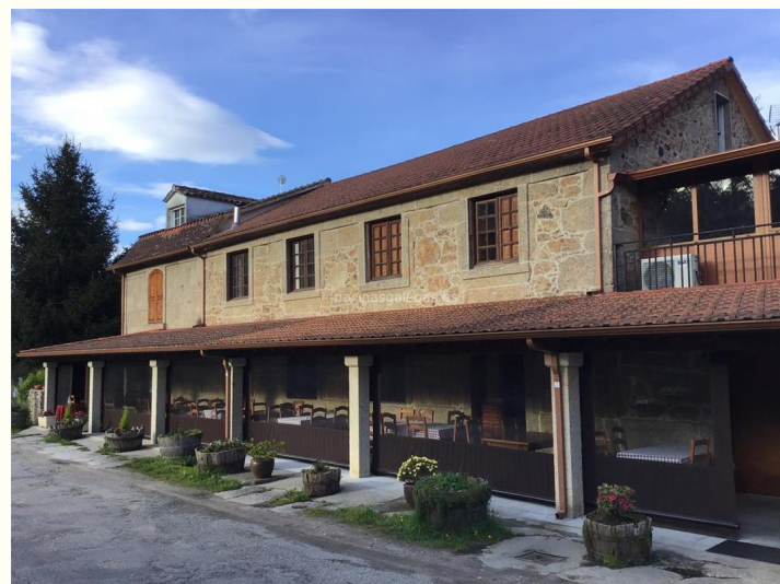
Restaurante A adega da tía Carme.