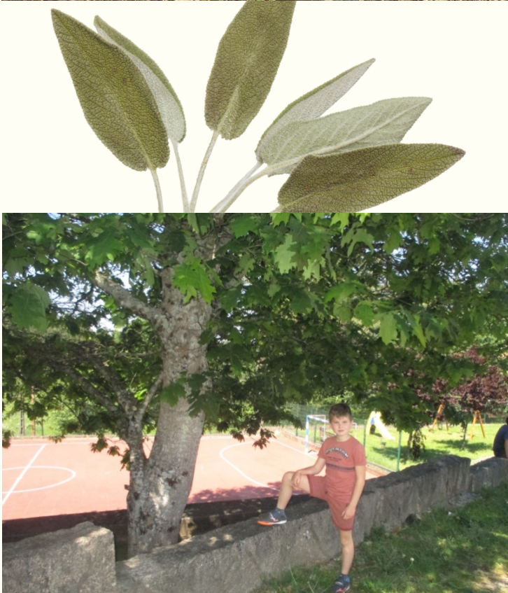
Parque da Arrufana.