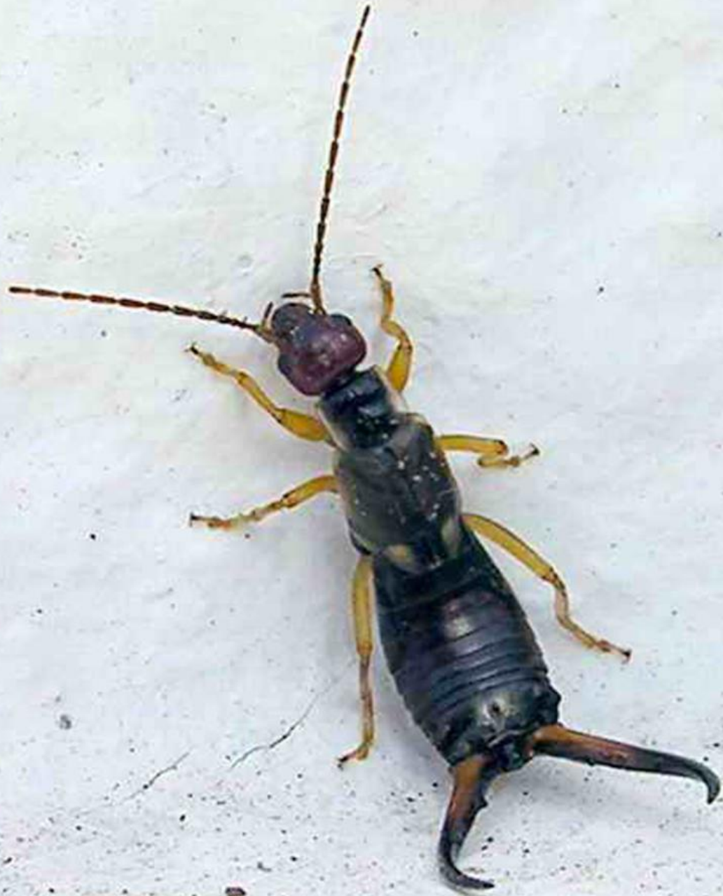
CADELA DE FRADE