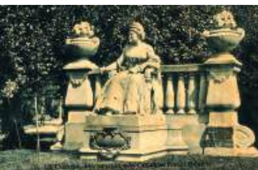
Monumento a Emilia Pardo Bazán. Xardíns de Méndez Núñez. 1916-1920.

Ela mesma sabía que non podería encaixar na vida dunha aristócrata convencional. A vocación pola escrita, a liberdade de pensamento e o atractivo dunha vida independente e libre foron máis fortes que calquera penalización social.