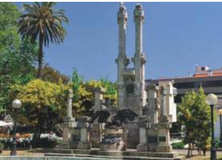
Monumento a Concepción Arenal. Xardíns de Méndez Núñez (A Coruña). Rafael González Villar. 1914.

pobres y de los encarcelados, procurando despertar el interés y la simpatía hacia esas dos clases infortunadas de la sociedad. A este fin, no nos limitamos a proclamar las excelencias de la caridad (...) sino que tratamos igualmente otras cuestiones de moral y conveniencia social: que también vemos caridad en ilustrar la ignorancia del pobre y liberarle de los errores con que a veces se pretende deslumbrarle y seducirle”.