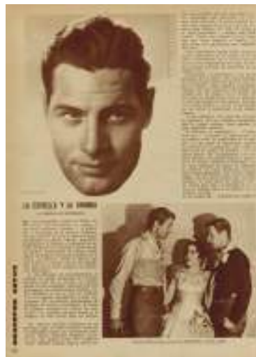
Films selectos. Semanario Cinematográfico Ilustrado . 27 de decembro de 1930.