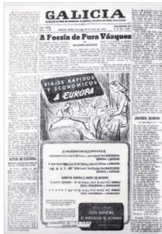
1952. Revista Galicia . Centro Galego de Bos Aires.

e foi a través dese xénero que ela descubriu a súa vocación docente. Porén, o contexto político e histórico que lle tocou vivir si lle presentou bastantes dificultades. Tivo que ver como o seu pai ía a prisión por causa das súas ideas de esquerdas e como o seu mozo sufriu a mesma sorte antes de morrer na guerra.