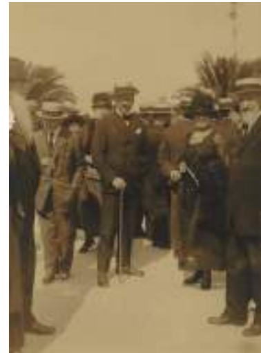
Homenaxe do Sporting Club o 30 de xullo de 1919 no parque do Leirón (A Coruña).

Menosprezada por un marido que a consideraba unha esposa fracasada por non