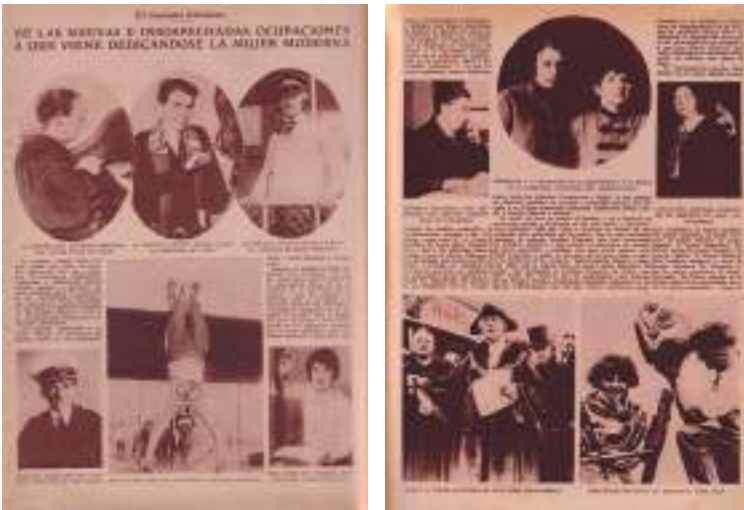
Xornal ABC. 16 de decembro de 1928.

A diferenza da tendencia estilística imperante na época, centrada fundamentalmente en aspectos políticos e militares dos conflitos armados, Sofía escribiu sobre as cuestións humanas e as persoas protagonistas directas destes conflitos.