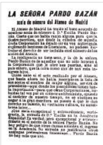
Emilia Pardo Bazán, primeira muller socia do Ateneo de Madrid. Recorte do xornal La Época . 15 de febreiro de 1905.

Tras a separación, a súa carreira comezou a despegar rapidamente: viaxou por toda Europa e serviuse da súa posición social para