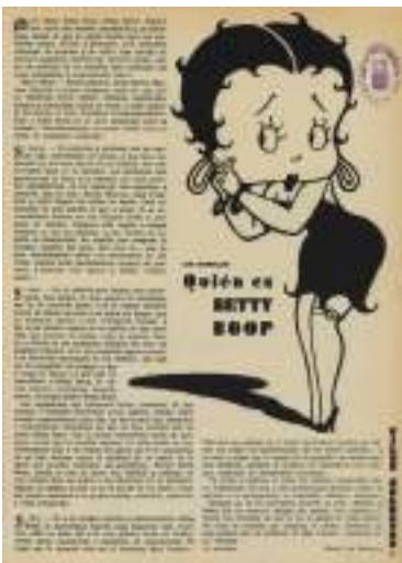
Films selectos. Semanario Cinematográfico Ilustrado . 25 de decembro de 1931.

Pero o compromiso co xornalismo puido máis que o medo. Durante a guerra, o consello obreiro noméaa directora do xornal e desempeña este labor durante seis meses de xeito impecable.