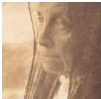
Retrato de Sofía Casanova en 1937.

Evacuada en varias ocasións das áreas en conflito, ás que viaxaba soa constantemente, non dubidaba en enfrontarse aos gardas que lle pechaban o paso, ou en formular as preguntas máis incómodas a importantes mandos da esfera política e militar. Obstionada, independente e libre, abriu camiño a outras mulleres pioneiras que, seguindo os seus pasos, conseguiron conquistar o seu propio lugar nun tipo de xornalismo que ata aquel momento, estaba dominado pola presenza masculina.