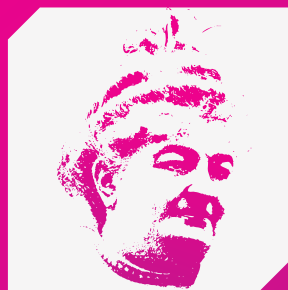
EMILIA PARDO BAZÁN