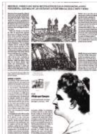
Xornal La Voz de Galicia . 7 de agosto de 2004.

Tampouco podemos pasar por alto a importancia da imaxe pública da personaxe, a súa presenza en lugares non habituais para as mulleres, tamén nos xornais, debuxaban unha persoa polémica. Súmase a esta crítica o seu