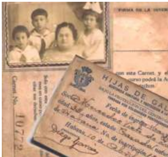
Carné de socia de Hijas de Galicia . http://culturagalega.gal/albumAlbum de mulleres .

necesitan un medio de vida que lles permita subsistir sen depender de ninguén. No seu caso, decide formarse como profesora de primaria, ao mesmo tempo que comeza a súa traxectoria como xornalista.