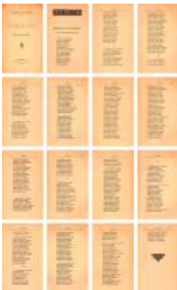
Filomena Dato Muruais (1891): Follatos. Poesías Gallegas . Ourense.

Aínda que a súa obra foi profusamente premiada e difundida nos xornais da época, Filomena viviu nun tempo no que o machismo era a norma, incluídos os círculos intelectuais nos que ela se movía. Iso fai aínda máis valiosa a