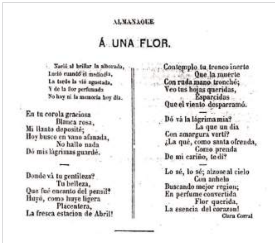
“A una flor”. En Almanaque de Galicia para uso de la juventud elegante y de buen tono . 1866.

Convive coa súa familia en distintas cidades de Galicia, e leva unha vida discreta, sen participar dos círculos intelectuais da época. A pesar diso, goza dun merecido