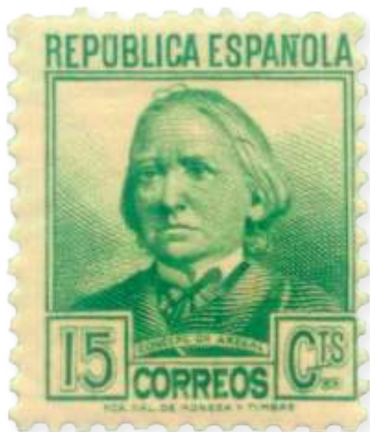
Concepción Arenal nun selo de 15 céntimos. Emitido entre 1933 e 1935.

pobres y de los encarcelados, procurando despertar el interés y la simpatía hacia esas dos clases infortunadas de la sociedad. A este fin, no nos limitamos a proclamar las excelencias de la caridad (...) sino que tratamos igualmente otras cuestiones de moral y conveniencia social: que también vemos caridad en ilustrar la ignorancia del pobre y liberarle de los errores con que a veces se pretende deslumbrarle y seducirle”.