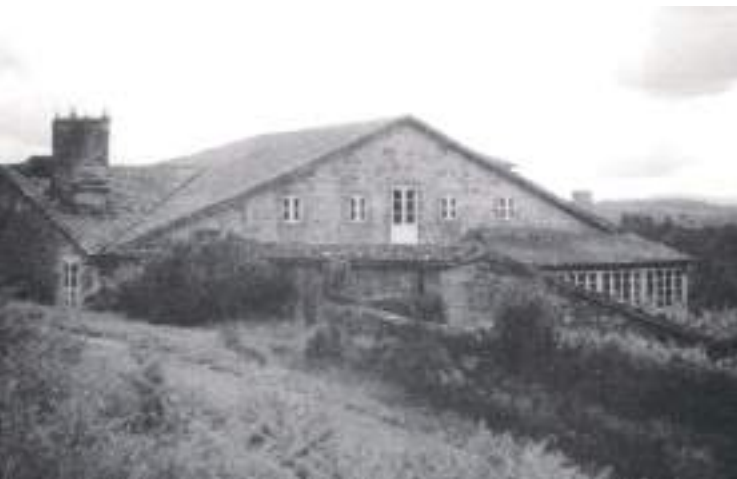
Casal de Vilancosta, Berres (A Estrada).

divulgativo, cando ve neles a posibilidade de axudar aos seus semellantes. Non busca recoñecemento, nin fama, nin cartos. Quizais por iso a meirande parte da súa obra poética ficou inédita ata moito despois da súa morte, e seguramente tamén sexa a razón de que a súa produción sexa tanta e tan variada: ao non esperar que moitos dos seus poemas chegasen a ver a luz, sentiuse libre para crear, fóra das rixidas estruturas e formalismos da academia. O resultado disto foi unha voz chea de frescura, espontaneidade e atrevemento.