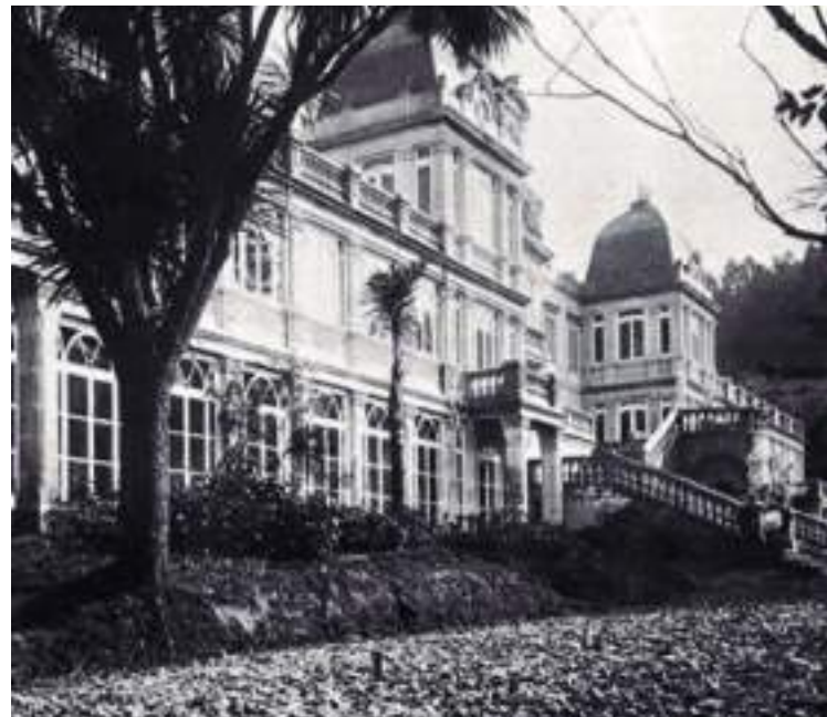
Pazo de Lourizán (Pontevedra). Filomena pasou os veráns no pazo da familia Montero Ríos. Fonte "Montero Ríos", en Gran Enciclopedia Gallega, XXI. Páx. 191. Santiago de Compostela, Silverio Cañada, 1974.