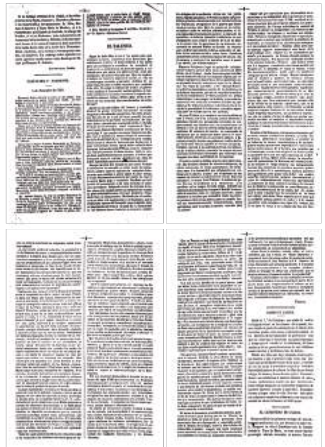
“El Talento”. En Galicia. Revista Universal . 1862

da Ilustración e o Humanismo, que se poden apreciar tamén en Felicia. Ela integrou sen problemas estes valores dentro da súa fe cristiá: valores como a tolerancia, a fraternidade e