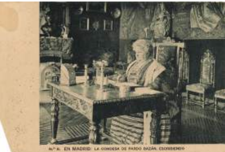
Excma. Sra. Condesa de Pardo Bazán. Madrid 1921.

relacionarse coa intelectualidade máis importante de cada país. Orgullosa e teimuda, proseguía incansable co seu labor creativo, invulnerable ante ataques e críticas. Vetaron a súa entrada na Real Academia Española polo simple feito de ser muller, a pesar de acumular e acreditar méritos sobrados. E cando conseguiu ser a primeira muller catedrática de España e dar clases na Universidade, as persoas matriculadas (influídas por prexuízos propios e a presión de profesores e colegas) deixaron de asistir ás súas leccións.