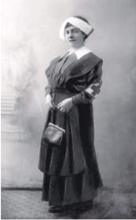
Sofía Casanova durante a I Guerra Mundial.

darlle un fillo varón e un estorbo na súa carreira, refuxiouse na escrita e no estudo das linguas (chegando a dominar máis de seis idiomas). A pesar dunha progresiva cegueira que a acompañou durante toda a vida e dun nulo apoio familiar, Sofía entregouse á súa paixón, e enfrontouse a unha sociedade que agardaba que priorizase o seu papel como nai sobre calquera outro aspecto vital. Co seu traballo foi o sostén económico desa familia que non a comprendía, e sorteando a censura soviética conseguiu que as súas crónicas adquirisen unha relevancia internacional nunca antes acadada por un muller no seu campo.