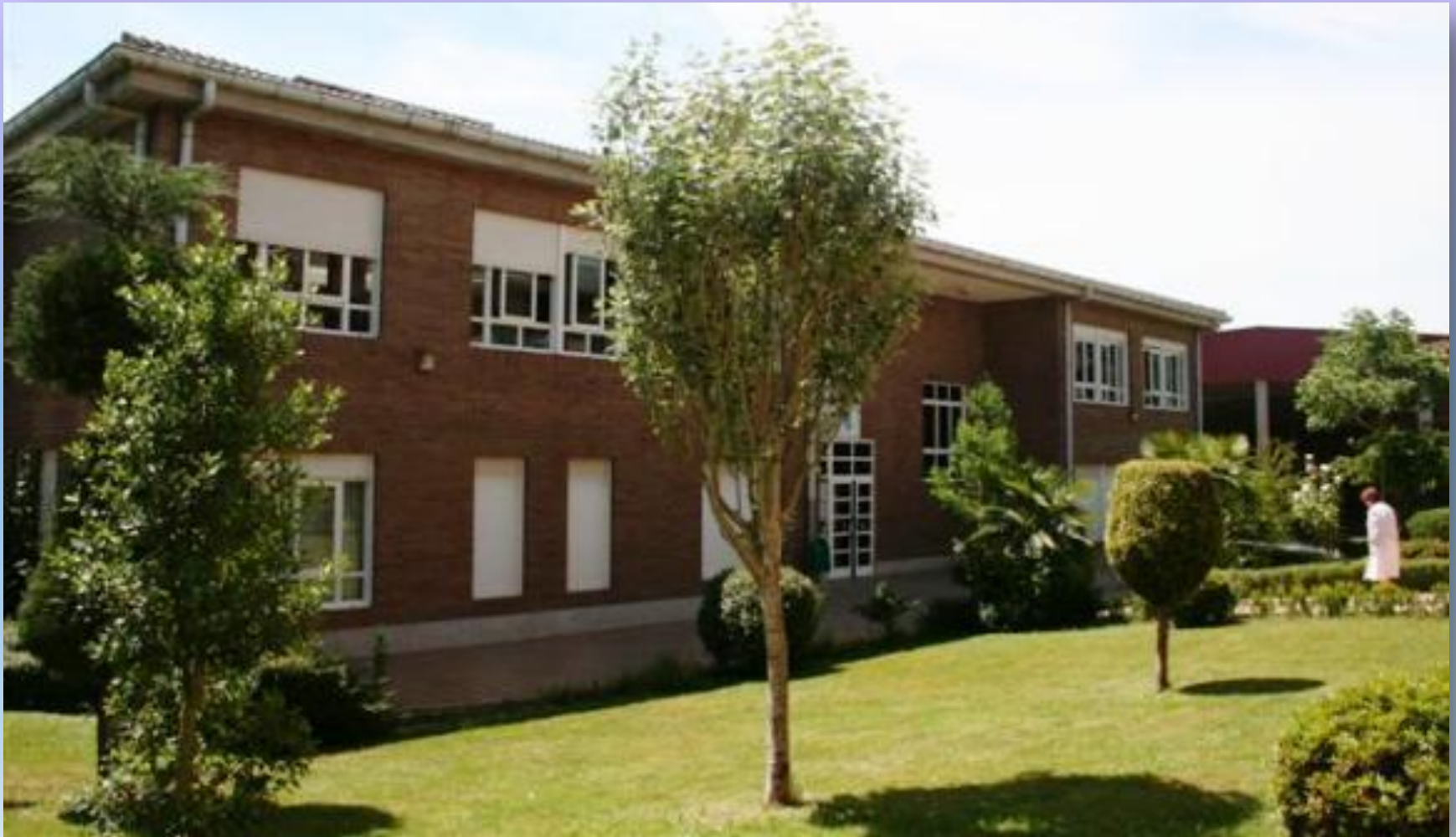
Rocío Varela Souto 6º B.