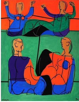
Diálogo e Alborozo de Luís Seoane