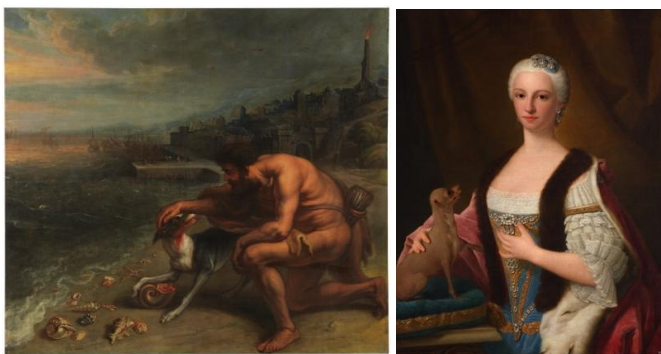
O descubrimento da Púrpura por Theodoor Van Thulden e O Retrato de M rs Antonia Fernanda de España por Domenico Duprà; ambos cadros en Depósito do Museo do Prado

**No Museo de Belas Artes da Coruña unha boa parte da súa colección atópase en Depósito. Actualmente contamos con moita obra en Depósito do Museo del Prado.