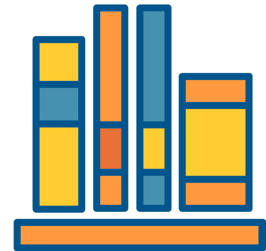
MATERIAS DE LIBRE CONFIGURACIÓN