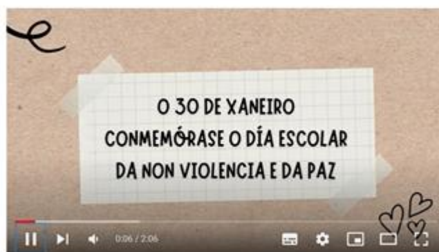
30 de xaneiro

https://www.youtube.com/watch?v=ALo8ytoci0k&t=36s