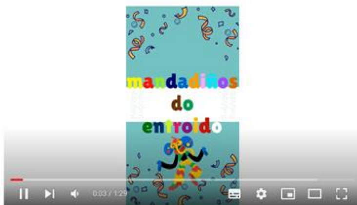
mandadiños do entroido

https://www.youtube.com/watch?v=ALo8ytoci0k&t=36s