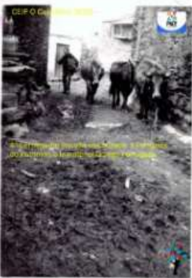
XABIER BLANCO BLANCO