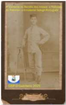
ELIÁN GONZÁLEZ MARTÍNEZ