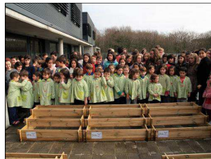
Leitugas, pementos de Padrón, tomates, herbas aromáticas e outras verduras e hortalizas serán sementadas na horta.

O pasado 15 de febreiro a Comunidade Educativa reuniuse para a inauguración da súa horta