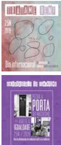
Cartelería dalgunha das campañas levadas a cabo no CEIP de Barouta