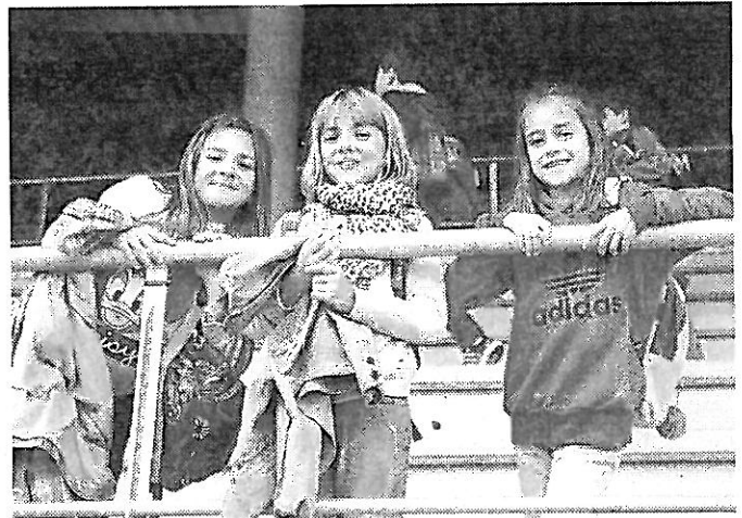
Los niños de Narón disfrutaron de lo lindo