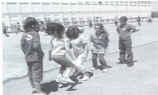
Xogando a liga no patio do colexio

O Triángulo: Consistía en saltar dun lado ao outro sempre apoiando os dous pés. O xogo tiña varias dificultades ( nos xeonllos, na parte inferior da cadeira... ). A segunda fase consistía en saltar dun lado ao outro a pata coxa ( as dificultades son as mesmas en cada unha das fases)