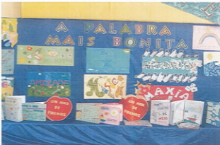
Exposición de carteis da palabra máis bonita e dos libros confeccionados polos noso alumn-