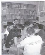
Alum@s na biblioteca do Ceip A Pedra

nenos, á verdade é que nos custou moito empezar a falar con eles, dábanos moita vergoña. Isto se solucionou en canto pasamos ao ximnasio e empezamos a fecer xogos en equipo nos que os alumnos dos dous coles estábamos misturados. O tempo pasounos voando, sobre todo cando nos puxemos a merendar todo o que