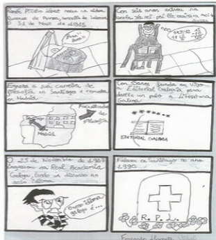
Cómic sobre a vida e obra de Ramón Piñeiro.

Todos os alumnos e alumnas do cole investigamos sobre este autor: fixemos unidades didácticas, elaboramos murais coa súa vida e obra.