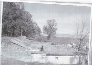
Antiga salgadeira na praia de Mourisco

Sabemos que na praia de Loureiro houbo polo menos unha salgadeira; na illa de Ons, tamén había unha fábrica... En fin ... foi unha charla moi interesante.