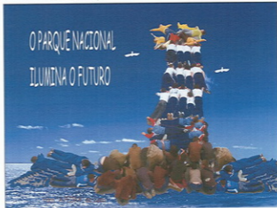
Composición vivente realizada polos alumnos e alumnas de 5º no patio do colexio.

Que fermoso foi poder disfrutar deste paraíso tan próximo!