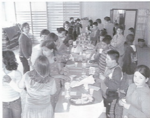
Merenda no Ceip, A Pedra

Xa para rematar, recibimos un diploma por participar nestas xornadas, que esperamos se poidan repetir o ano que ven. ¡Esperamos a vosa visita!