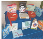
Nós facemos biblioteca

Supoño que xa todos lle botastes unha ollada na exposición de libros "Nos facemos biblioteca" que se atopa na entrada do colexio. Alí están os nosos corazóns vermello cheos cos vosos poemas e debuxos.