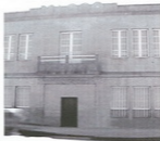
Fábrica de Masó convertida en museo

Sabías que ...? Se metes unha lata nunha oia a 6º graos, incha e explota.