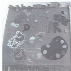
Pancarta do entroido do 1º ciclo

E por fin chegou o día!! E como ben di a canción, os de 1º fomos de cocineiros e os de 2º de pintores. Que guapísimos fomos no desfile do cole, percorrendo todo Bueu, tarareando e nosa canción e lucindo os nosos traxes.