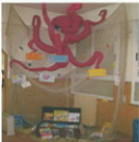
Papyrus no seu Bibliocastelo

Xa todos/as me coñecedes, son a vosa mascota Papyrus, pero por se aínda hai algún despistado que xa non se lembre de min, empezarei contándovos un pouco a miña historia: