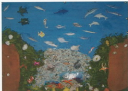
Mural realizado polos netos e netas de 3º ciclo

Na Unión europea existe un órgano, chamado Consultivo Re-