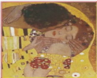
"El Bacio" de Gustav Klimt

En Italia celebran un banquete coma se dunha gran festa se tratase