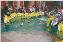
Os pequenos na praza do concello

orballo con ameaza de choiva forte, non os deixou, os disfraces empezaron a descolorar!!! Foi unha faena!!! Os de primaria continuaron o percorrido para voltear ao cole, pero como isto do tempo non hai quen o entenda, deixou de orballar e puideron ir ao concello. Daba gusto velos a todos xuntos disfrazados, levando pancartas e cantando por Bueu. Diante da casa do concello bailouse e representáronse contigas, eee sorpresa!!! Tamén apareceron os nenos de 4 anos, os mariñeiros, para reivindicar coa súa cantiga a necesidade dun novo ximnasio!