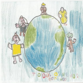
Debuxo de Yara

Todos os nenos do mundo Teñen dereito a ter algún xoguete para xogar e algún amigo Para charlar. (Mariña)