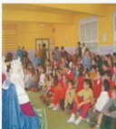
Visita dos Reis Magos ao colexio

Cando rematou o festival marchouse de volta ao cole, tanto paseo e tanta diversión abriu o apetito, en cada aula preparouse unha comellona navideña cos doces que cada neno e nena trouxo da súa casa, qué bo estaba todo!! No medio da troula e da ledicia unha importante visita chegou ao cole, quen podía ser? Sí sí!!! As nosas maxestades OS REIS MAGOS!! Por grupos os nenos tiveron a oportunidade de saudalos e de recordarlles a súa lista de peticións, eles moi