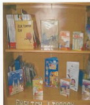
Ándel da sección de inglés da biblioteca