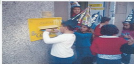
Nenos e nenas de 2º botando cartas no buzón.

Áo remate da visita botamos as postais no buzón correspondente e despois impacientemente esperamos a que chegasen ás nosas casas para saber que nos escribieran os compañeiros e compañeiras.