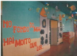
A entrada da nova biblioteca

Invitei a todos os nenos e nenas ao meu Bibliocastelo que foron chegando aos poucos ao longo da mañá.