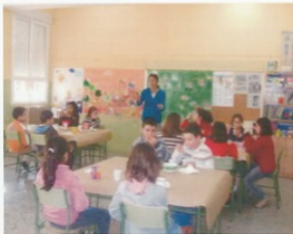
Nenos e nenas de 3º saboreando un almorzo saudable

-As verduras e hortalizas podémolas tomar cociñadas de moitos xeitos.