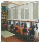
Nenos e nenas no recuncho informático

un novo horario nos recreos para o uso da biblioteca e dos ordenadores debido a que erades moitos os que viñades cambiar libros e a empregar o ordenador.