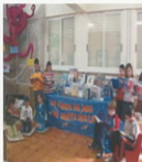
Nenos e nenas na exposición do mar