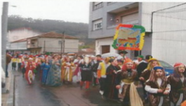
Desfile dos nenos e nenas de A Pedra por Bueu.

Á volta, os nenos e nenas de infantil déronlle a benvida ao novo ano 2008, fixeron a conta atrás pedindo un desexo e tomando un "lacasito" por cada unha das doce badaladas, como é de esperar este foi un día de