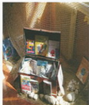
Cofre dos tesouros de Pápirus

Como todos xa sabedes, este ano concedéronnos o Plan de Mellora de Bibliotecas Escolares, que é un "premio" que nos deron por traballar tanto e ben na biblioteca, para que todos poidades aproveitarvos dos libros e da lectura. Os profes do CEIP A PEDRA máis eu recibimos uns cartas, e así foi como puidemos facer as obras para ampliar o meu Bibliocastelo, agora temos o dobre de espacia, a verdade é que xa estaba quedando un pouco pequeno ¿a que quedou chulo?! Agora pódeme ver no meu novo recuncho "O RECUNCHO DE PÁPIRUS", teño un cofre de tesouros cheo sempre de libros novos que vou mercando nos meus viaxes, espero que che gusten todos! Xa sabes que aínda non os podes levar para casa ata que estean nos andeis.