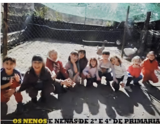
https://www.youtube.com/watch?v=4W03WabutJY 2º E 4º NO NOSO INVERNADOIRO