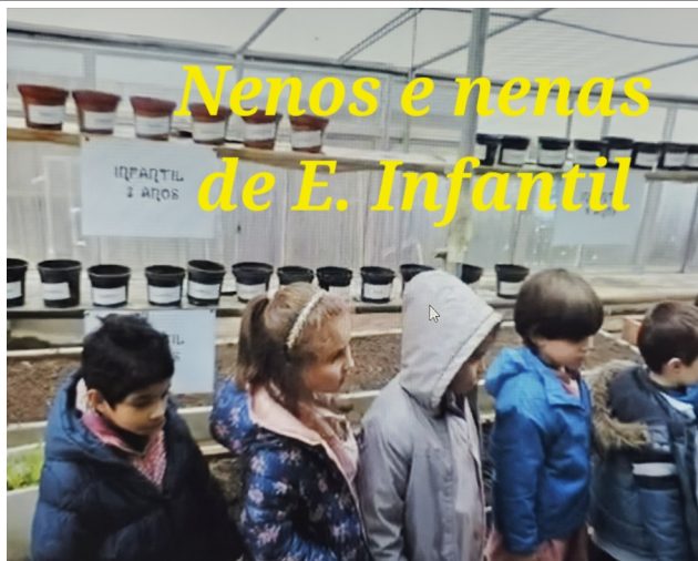
https://www.youtube.com/watch?v=VBjVbds2qq0 E. INFANTIL NO NOSO INVERNADOIRO