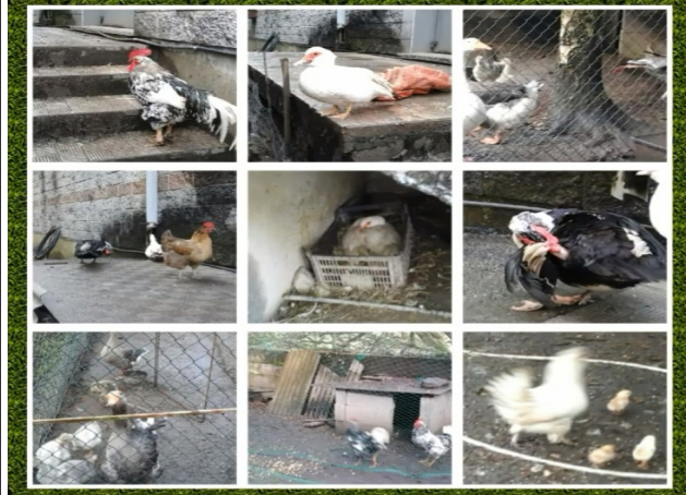
https://www.youtube.com/watch?v=cNNRYPuMmHI A NOSA GRANXA