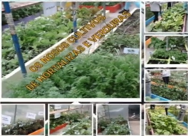
https://www.youtube.com/watch?v=VOBmZavaC7w OS NÓSOS CULTIVOS