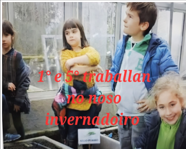
https://www.youtube.com/watch?v=1lwUy5tN7zg 1º E 5º NO NOSO INVERNADOIRO